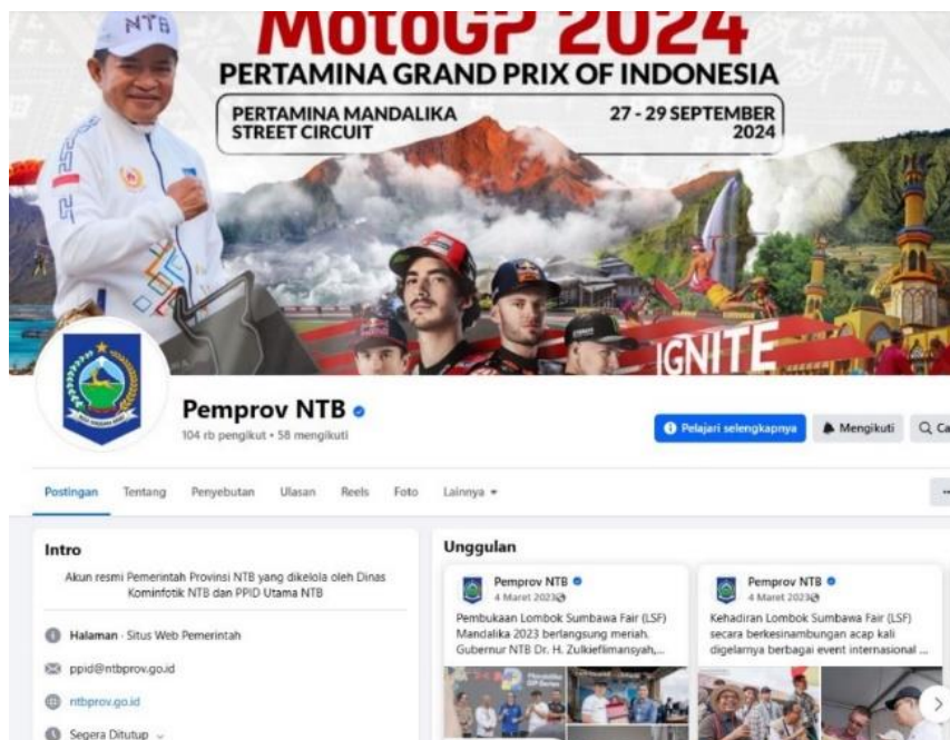
Gambar 1: Laman resmi Facebook Pemprov Ntb.

Pada tahun 2024, sekitar 56% pengguna media sosial Indonesia melaporkan bahwa mereka lebih selektif dalam memilih informasi yang mereka konsumsi dan lebih cenderung mencari sumber informasi yang terpercaya dan terverifikasi (Norliani et al., 2024).